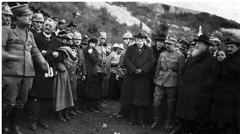
Ponis, zapovjednik Riječkih vatrogasaca u žučnoj raspravi s D'Annunzijem i gradskom vlašću.