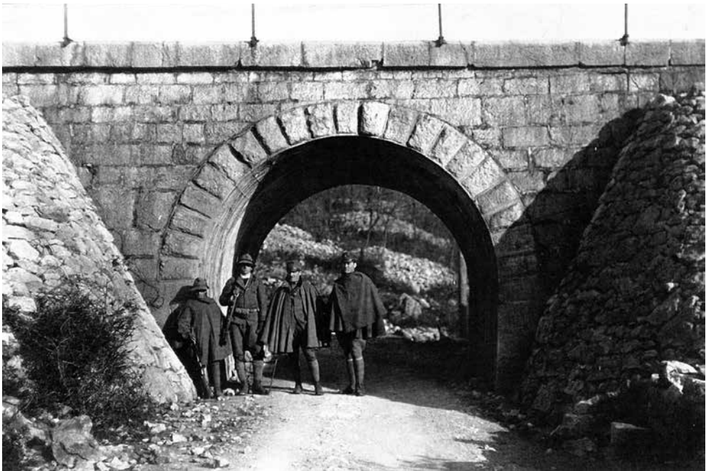
Straža ardita ispod željezničkog mosta na putu koji povezuje Kantridu i Zemet.

Gabriele D'Annunzio je 12. rujna 1919. godine ujutro rano ušao sa vojskom u grad Rijeku. D'Annunzio je stigao dan ranije iz Venecije u Ronki u Goričkoj, odakle se uputio s vojskom dalje, a putem su mu se pridružili i drugi vojnici. Veliki dio vojske se okupio oko njega u mjestu Matulji. Drugi dio vojske kretao se je Kastavštinom i to mjestima Jurdani, Jušići, pa su preko Belića, Čikovića, Jurčića i Zameta ušli u Rijeku. Toga dana, 12. rujna u selu Čikovići dogodila se strašna nesreća. Djeca su našla odbačenu ručnu granatu od strane D'Annunzijeve vojske i njome se igrali. Granata je odjedanput eksplodirala. Pri tome je poginulo i teško nastradalo petero