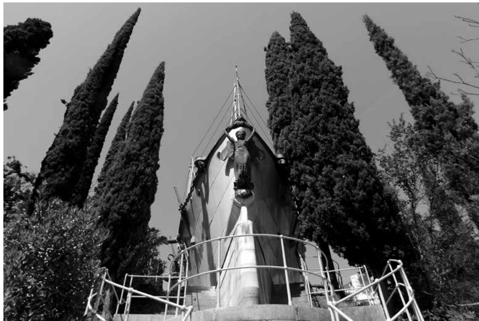
Brod Puglia s pramcem usmjerenim prema Jadranu ukopan je u brdu kompleksa Vittoriale, a prevezen je do D'Annunzijevo političkog 'Gardalanda' iz 300 km udaljene luke La Spezia

ju, zapovjedniku talijanskih jedinica u sastavu savezničkih snaga u Rijeci, odluku o sjedinjenju grada s Italijom, ali general tada nije bio spreman anektirati riječko područje. Među ratnim saveznicima nastao je zbog Rijeke ozbiljan spor, a u gradu je ključalo jer je u proljeće 1919. ovdje bilo stacionirano više tisuća tisuća talijanskih (para)vojnih snaga pod oružjem te nekoliko bataljuna britanskih, francuskih i američkih vojnika. U lipnju 1919. godine izbili su krvave sukobi između talijanskih i francuskih kolonijalnih vojnika u luci Baroš. Nakon toga, pod međunarodnim pritiskom, Talijansko nacionalno vijeće je raspušteno, a Rijeku su 27. kolovoza 1919. morali napustiti sardinijski grenadiri (Granatieri di Sardegna). Dio te vojne jedinice, premještene u mjesto Ronchi kod Trsta, postao je nukleus paravojske koja je dva tjedna kasnije pod D'Annunzijevim zapovijedanjem bez otpora ušla u Rijeku 12. rujna 1919. godine. 5