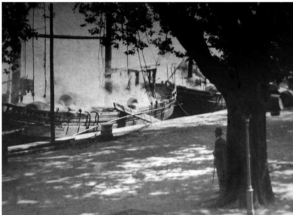
Palež hrvatskih brodova na Mrtvom kanalu u blizini Trga bana Jelačića, 14. srpnja 1920.